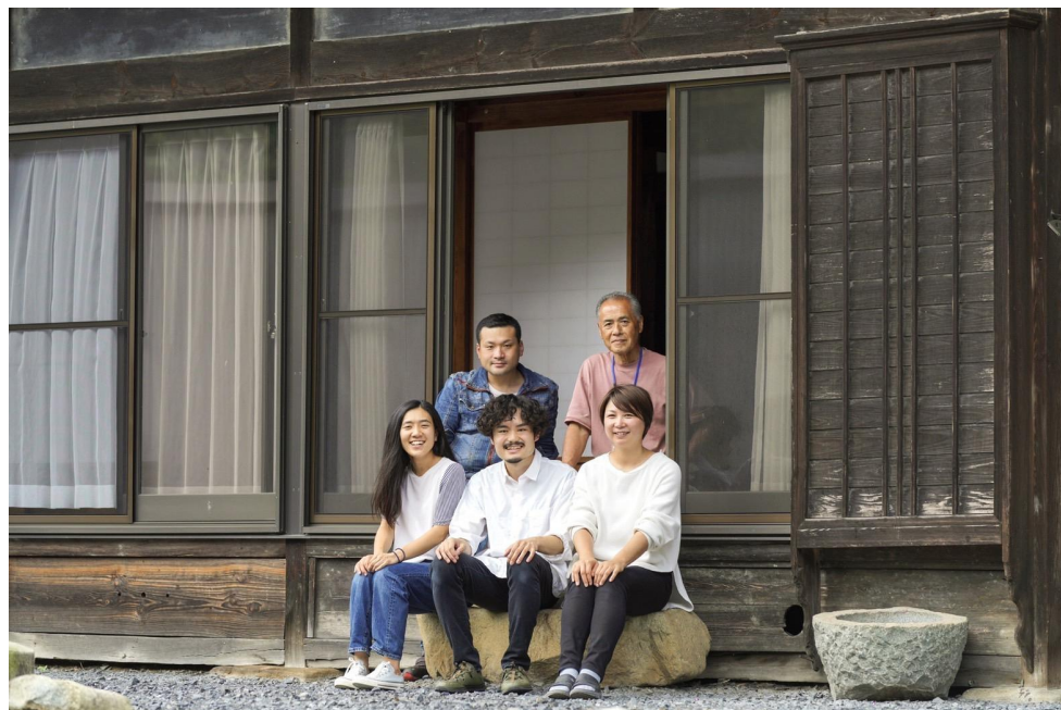
スタッフは町民と地域おこし協力隊現役&OBの6名。真ん中にワーホリ生