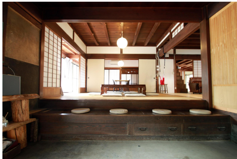
古民家を改修した白川町移住交流サポートセンターが勤務場所です。

現在は築100年の古民家を拠点に、スタッフ6名で移住相談窓口や空き家バンクの運営、空き家調査などを行っています。そのほかにもゲストハウスや若者向けシェアハウスの管理、地域資源を活かしたグリーンツーリズムやワーケーションなどの業務も行っていきます。