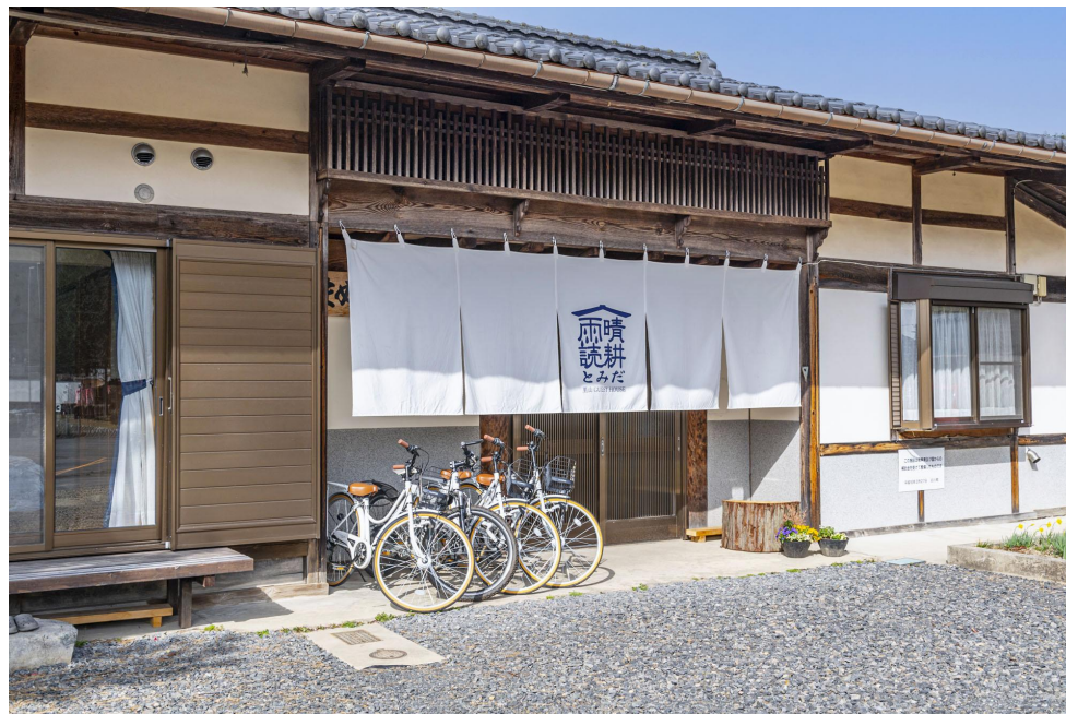
古民家を改修した里山ゲストハウス晴耕雨読とみだも私たちの職場です。